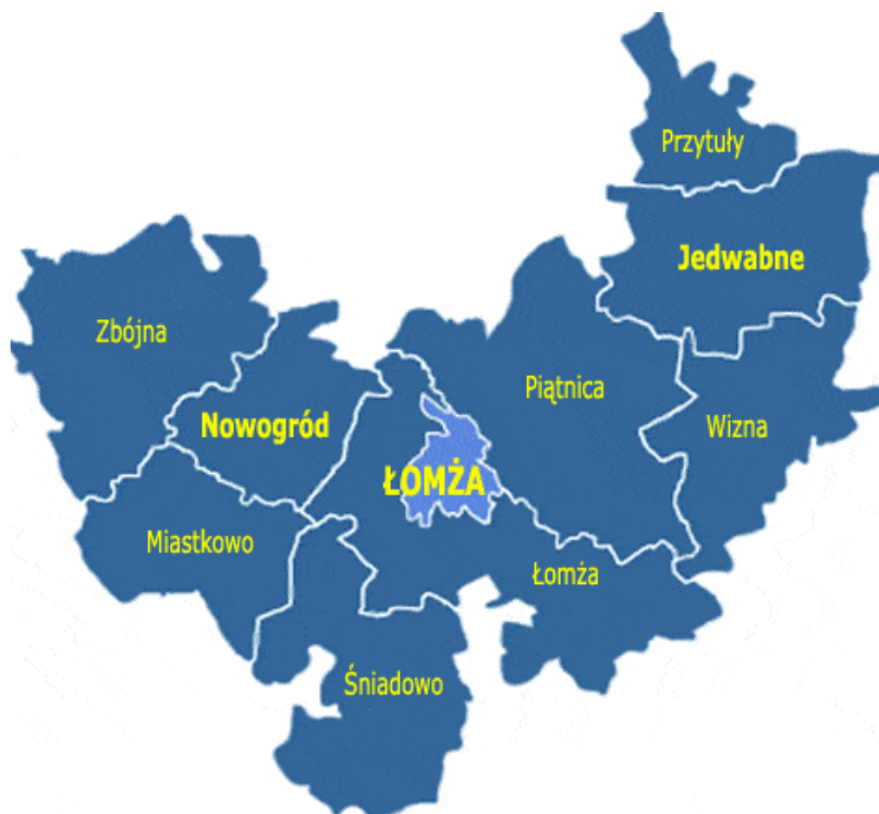
Rys. 1. Gmina Wizna w powiecie łomżyńskim.

Gmina Wizna położona jest w zachodniej części województwa podlaskiego. Należy do powiatu łomżyńskiego i jest zlokalizowana w jego wschodniej części (rys.1). Od strony północnej gmina Wizna graniczy z gminą Jedwabne, od zachodniej z gminą Piątnica, od Południa z gminami Rutki (powiat zambrowski) i Łomża, a od Wschodu z gminami Zawady (powiat Białostocki) i Trzcianne (powiat moniecki). Teren gminy podzielony jest na 24 sołectwa. Gmina Wizna jest szóstą w powiecie łomżyńskim pod względem zajmowanej powierzchni (9,8% powierzchni powiatu łomżyńskiego) i liczy około 13 305 ha (133 km 2 ).